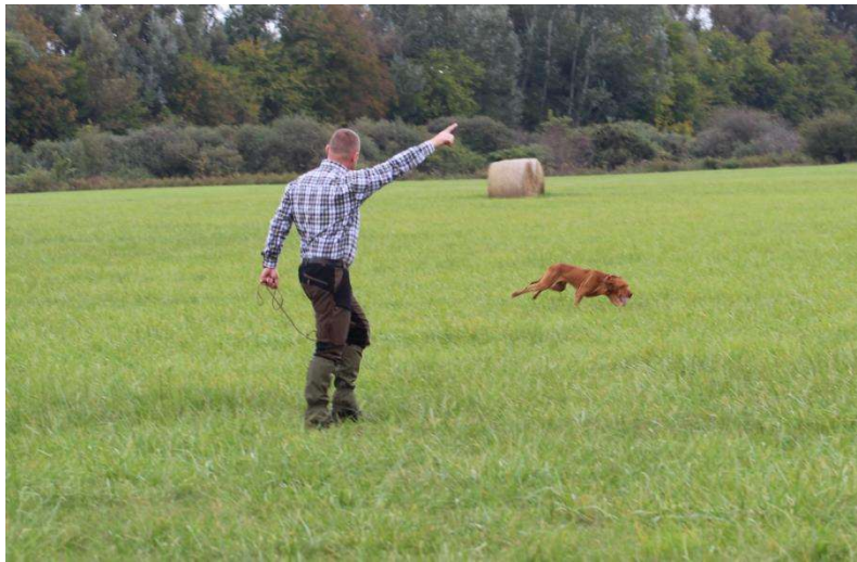
Egyik felvezető kutyájával mezei munka közben

Mezei helyszíneken tollas, szőrmés vonzalékot és légszimatos elhozást kellett kidolgozni, az ismert szabályrendszer szerint.