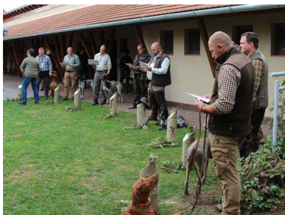
Megnyitó utáni eligazítás