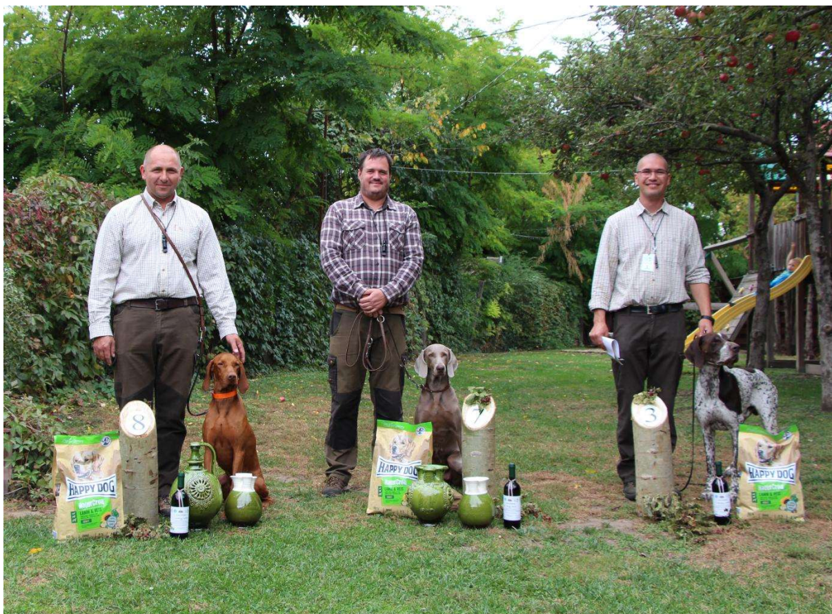
Az első három helyezett