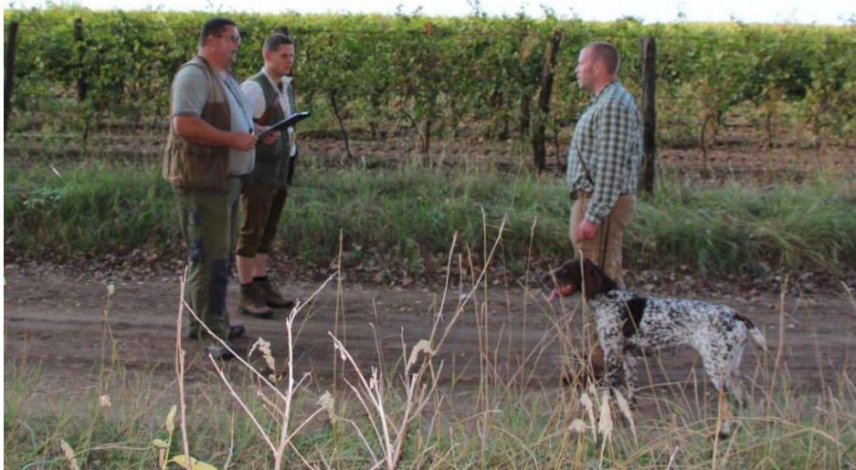
Feladat végrehajtását követő bírálat

A feladatok végrehajtása végén a bíró sporttársak értékelték a bemutatott feladatot. A vezetők sokat tanulhattak egymás munkáját látva, illetve a bírók korrekt és építő jellegű bírázataiból, jótanácsaiból. Nem volt megállás, minden értékelés után indulni kellett a következő versenyállomásra, ami mentálisan is elfárasztotta kutyát és vezetőjét, hiszen öt állomást kellett teljesíteni.