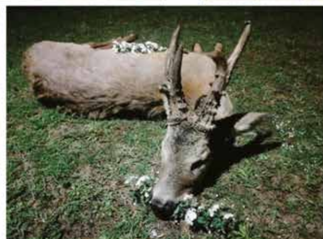
Trófea tömege: 560 gr * CIC: 155,43 * Minősítés: ARANY