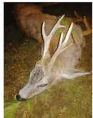
Trófea tömege: 402 gr CIC: 105,33 Minősítés: BRONZ