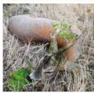
Trófea tömege: 477 gr * CIC: 118,23 Minősítés: EZÜST