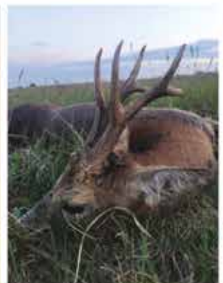
Trófea tömege: 417 gr. CIC: 117,65 Minősítés: EZÜST